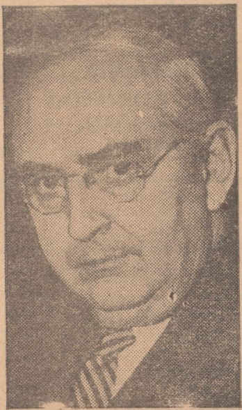
VAN DEN BERGH

De bekende Senator Van den Berg van de stad Michigan, verklaarde, dat de Verenigde Staten niet te lang kunnen wachten op de samenstelling van een uiteindelijk vrede voor Europa, indien men een overeenkomst zou